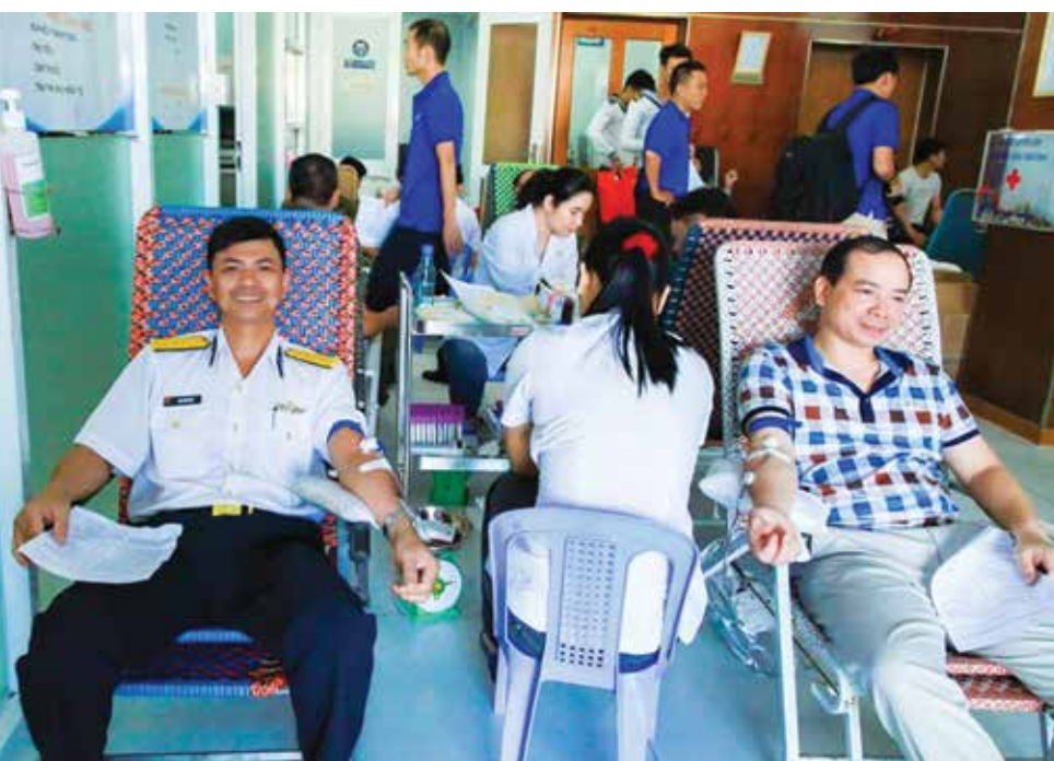
Cán bộ Công ty CP Dịch vụ kỹ thuật Tân cảng tham gia hiến máu

Sự thành công của ngày Hội có ý nghĩa vô cùng quan trọng góp phần giúp những bệnh nhân hoàn cảnh khó khăn ở trong tình thế hiểm nghèo cần được truyền máu, giúp họ có thêm động lực vượt qua hiểm nguy của bệnh tật và có thêm niềm tin, sự hy vọng vào cuộc sống. Sau 5 năm thực hiện, đã có 1.869 lượt người tham gia và hiến tặng được hơn 2000 đơn vị máu cho phong trào; là tấm lòng nhân ái, nghĩa cử cao đẹp Vì cộng đồng - Vì đồng đội của Người lao động Tổng công ty TCSG ■