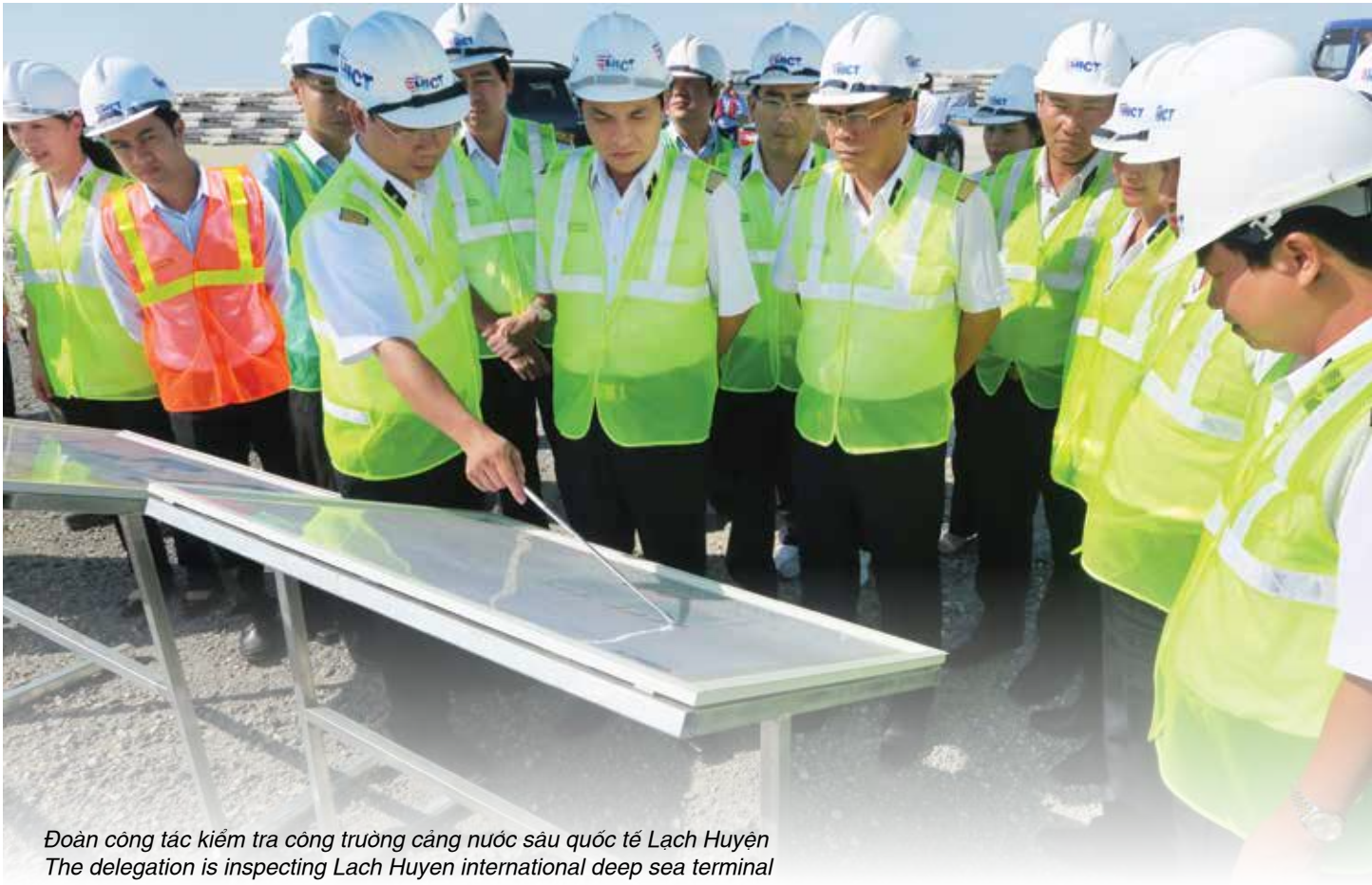
Đoàn công tác kiểm tra công trường cảng nước sâu quốc tế Lạch Huyện The delegation is inspecting Lach Huyen international deep sea terminal