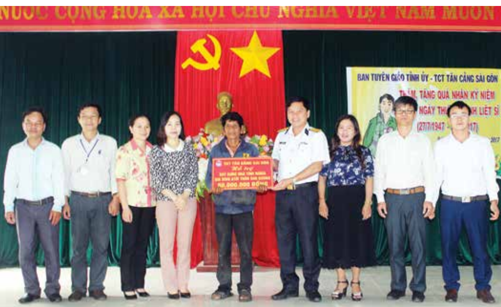
Trao nhà tình nghĩa tại tỉnh Kon Tum