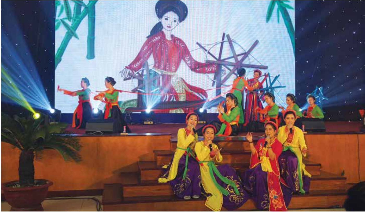
Tiết mục tham gia Liên hoan của HPNCs ĐLGNVTXDTC, SNPL, DVKT, Hoa tiêu, TTYT, TH1, TH2, VTB, TC Miền Trung.