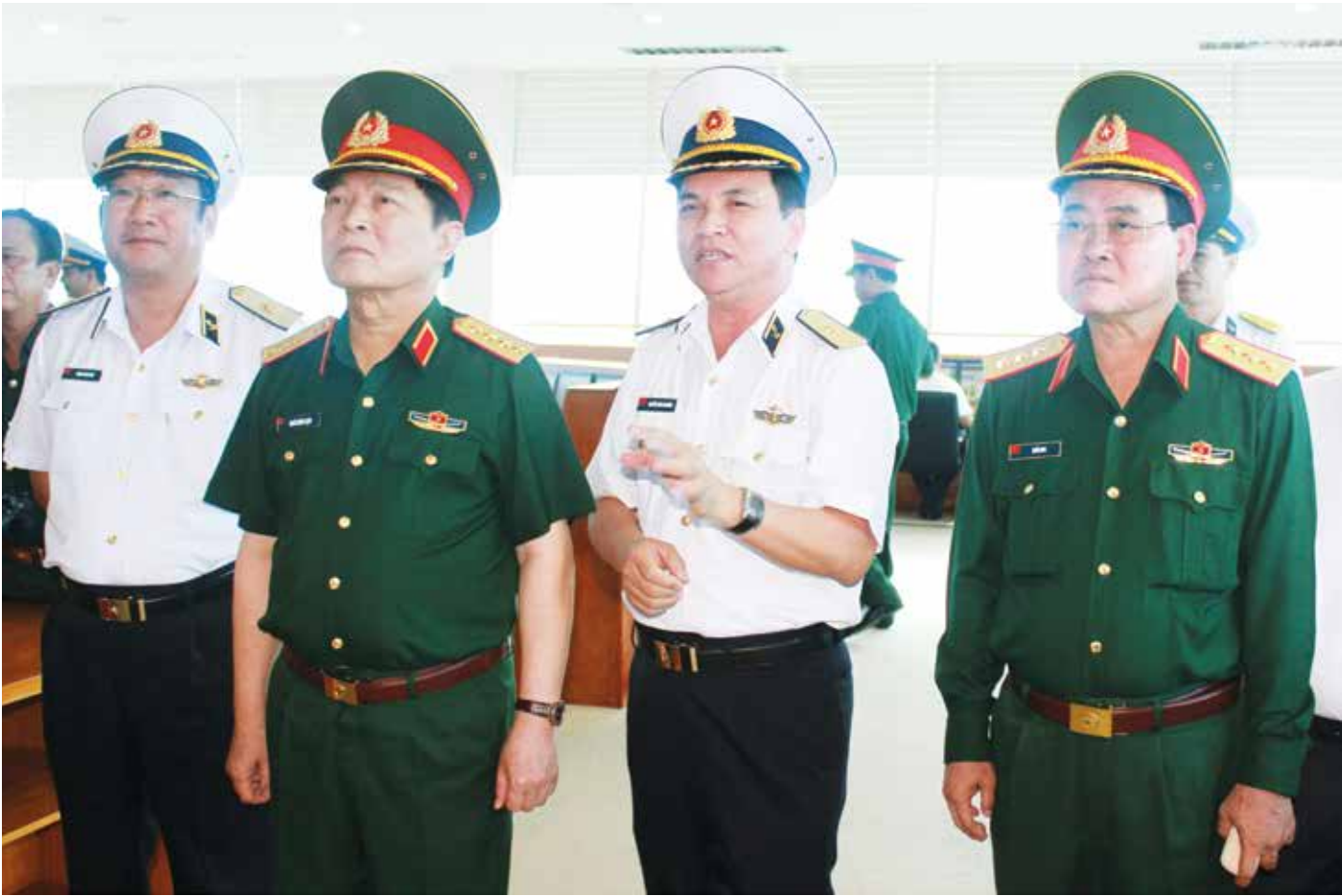
Đại tướng Ngô Xuân Lịch, UVBCT, Phó Bí thư Quân ủy Trung ương, Bộ Trưởng Bộ Quốc phòng cùng đoàn công tác thăm Trung tâm điều hành sản xuất cảng Cát Lái.

thành những đối tác kinh tế có uy tín. Các thương hiệu như: Viettel ở lĩnh vực viễn thông, Tân cảng ở lĩnh vực dịch vụ cảng biển, Công ty trực thăng ở lĩnh vực bay dịch vụ, Ngân hàng TMCP Quân đội ở lĩnh vực ngân hàng... là những thương hiệu có uy tín trong phạm vi cả nước và quốc tế.