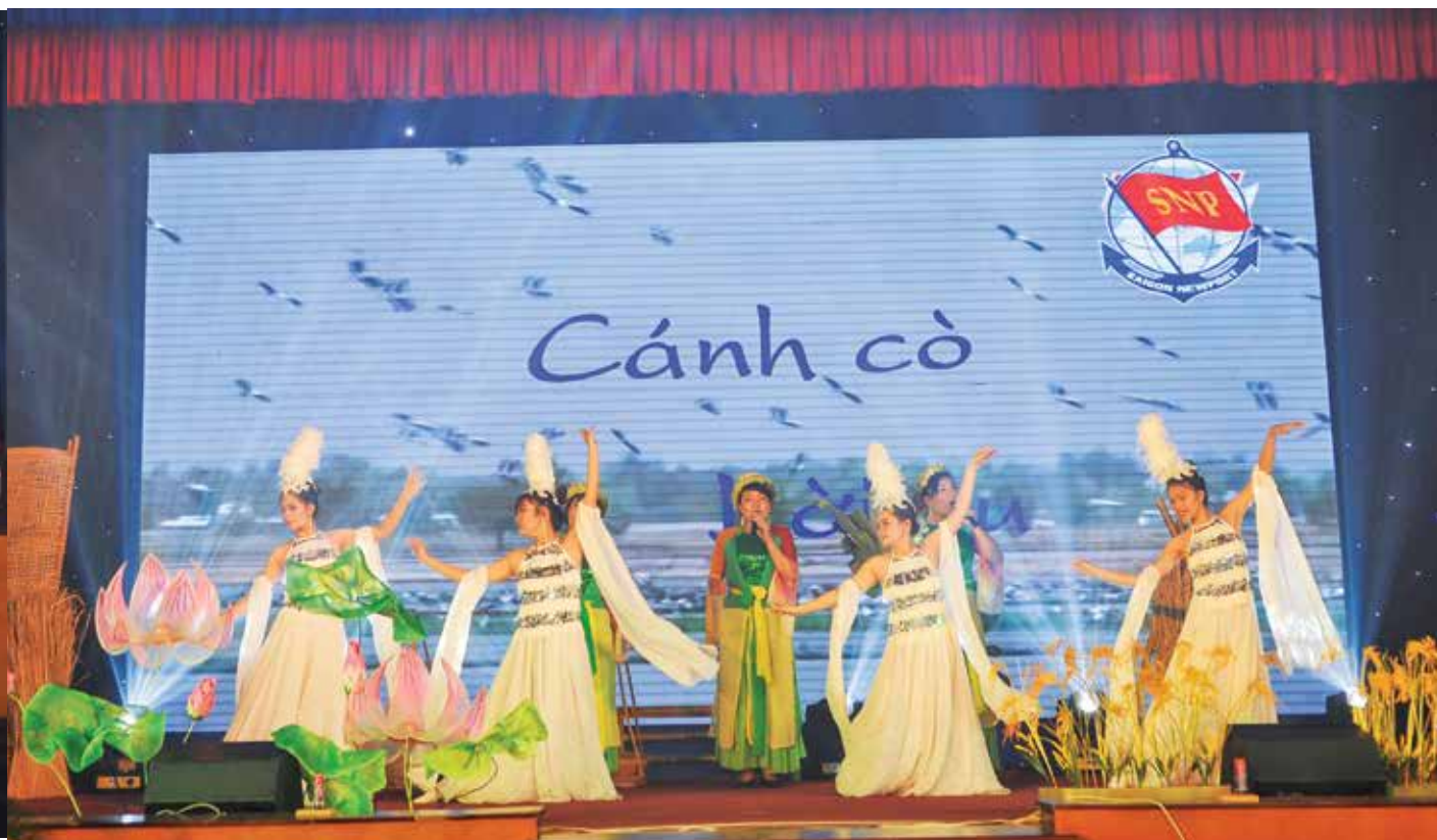
Tiết mục tham gia Liên hoan của ICD TC - Sóng thần, ICD TC - Long Bình, QSBV, VTT, DVHH, Petro Cam Ranh