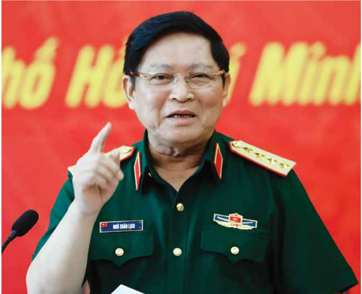
Đại tướng Ngô Xuân Lịch, UVBCT, Phó Bí thư Quân ủy Trung ương, Bộ Trưởng Bộ Quốc phòng phát biểu chỉ đạo tại Tổng công ty

TỔNG CÔNG TY TÂN CẢNG SÀI GÒN XỨNG ĐÁNG LÀ NIỀM TỰ HÀO CỦA ĐẤT NƯỚC, CỦA QUÂN ĐỘI, MINH CHỨNG ĐÚNG ĐẮN TRONG XÂY DỰNG, PHÁT TRIỂN CÁC DOANH NGHIỆP QUÂN ĐỘI