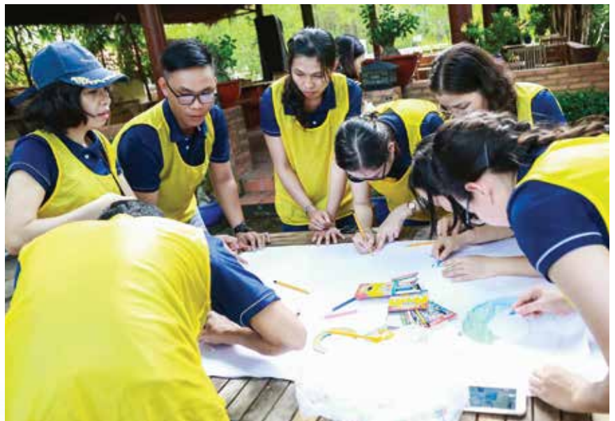
Tập huấn kỹ năng tổ chức hoạt động sinh hoạt tập thể