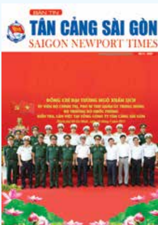
Ảnh: P. Chính trị

GPXB số 06/QĐ-XBBT-STTTT TP. HCM ngày 29/06/2015 Số lượng: 2.000 In tại Công ty In Ấn 28/1 Đặng Văn Ngữ, P. 10, Q. PN, TP. HCM