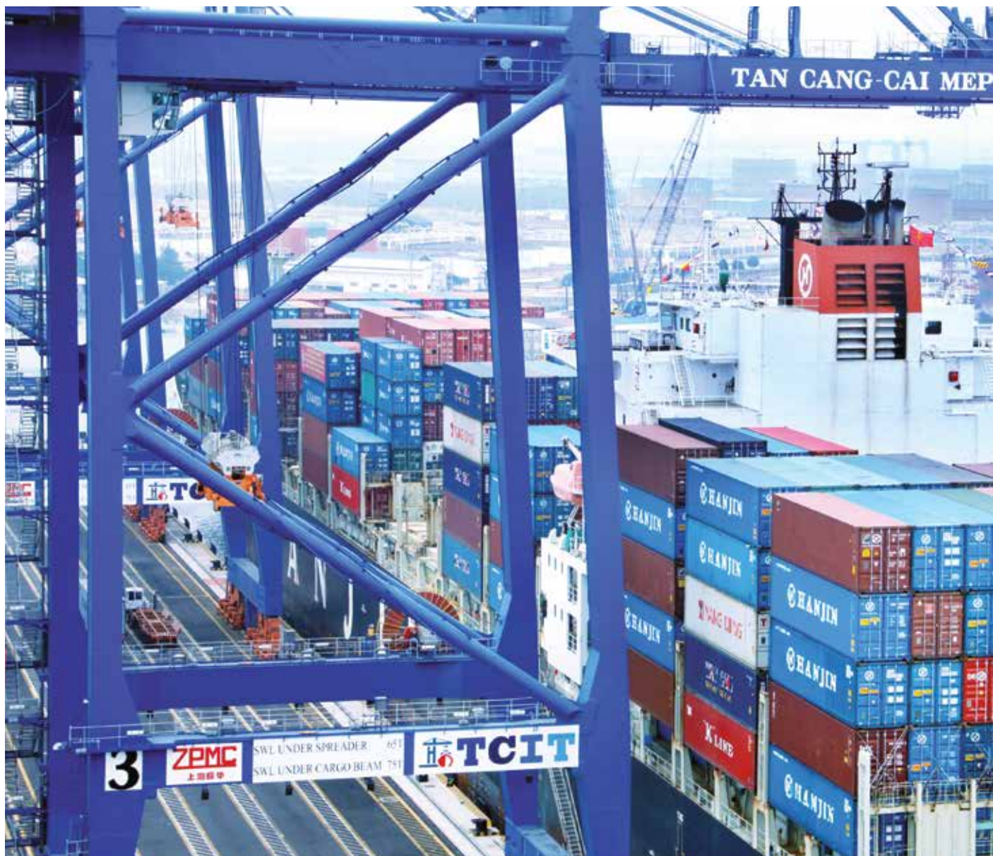
Làm hàng tại Cảng container quốc tế Tân cảng – Cái Mép

tổng thể với hệ thống khác dựa trên Internet. Cảng Hamburg là nơi sớm ứng dụng thành tựu CMCN 4.0 để tính toán tối ưu, rút ngắn quá trình giao hàng, nâng cao hiệu quả sử dụng phương tiện, từ đó làm giảm chi phí, nâng cao khả năng cạnh tranh, góp phần đưa Hamburg trở thành cảng container đứng thứ nhì Châu Âu.