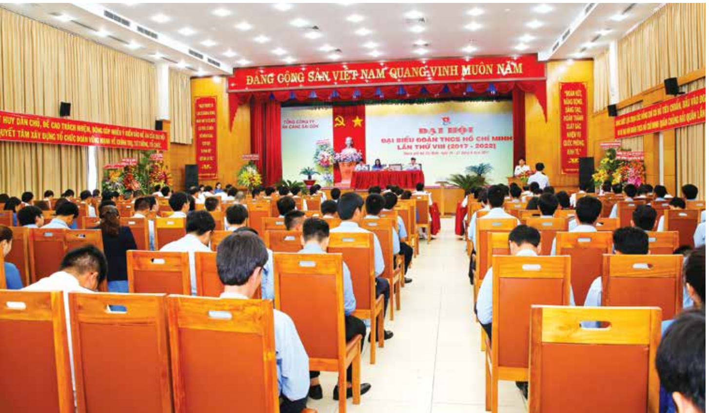
Quang cảnh Đại hội

Với khẩu hiệu hành động “Tiên phong, đoàn kết, đổi mới, sáng tạo”, tuổi trẻ TCT TCSG luôn nêu cao tinh thần xung kích, sáng tạo, tận tâm, tận lực, trí tuệ xây dựng nhiều mô hình, phong trào hoạt động hiệu quả trong giai đoạn 2017- 2022, hoàn thành xuất sắc nhiệm vụ QSQP, SXKD; xây dựng Tổng công ty phát triển bền vững, phấn đấu trở thành tập đoàn kinh tế - quốc phòng hàng đầu trong lĩnh vực kinh tế biển và logistics ■