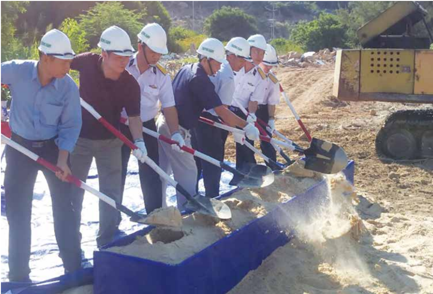
Các Đại biểu động thổ khởi công nhà khách Tân cảng – Petro Cam Ranh