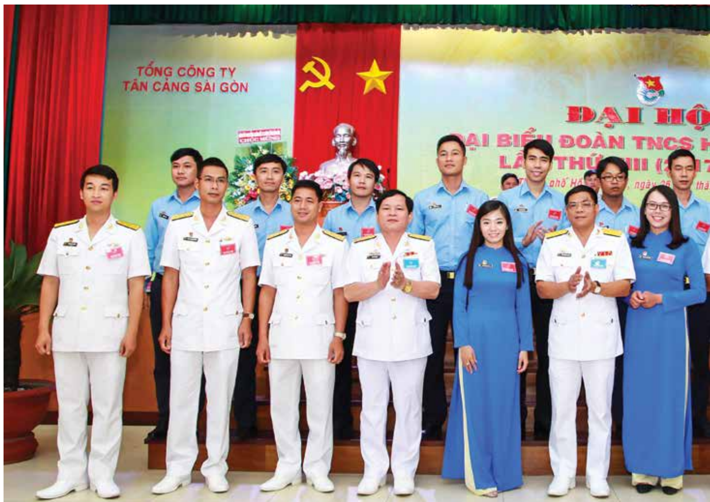
ĐU, Ban TGD và Ban Thanh niên HQ chúc mừng Đoàn đại biểu đi dự ĐH Đoàn TNCS Hồ Chí Minh QCHQ lần thứ VIII.

quả, đã được báo cáo điển hình tại hội nghị xây dựng mô hình thanh niên điển hình toàn Quân năm 2010 và Tổng cục Chính trị tặng Bằng khen.