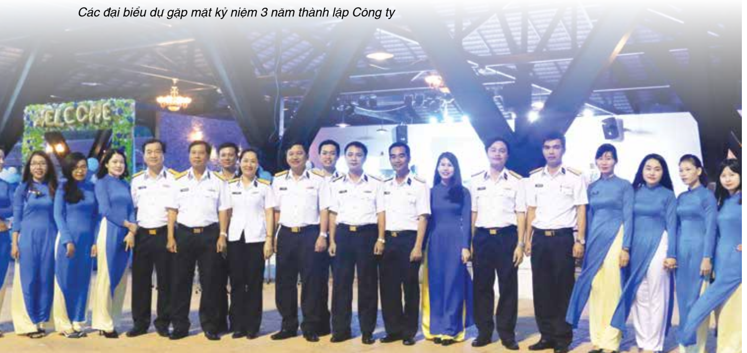
Các đại biểu dự gặp mặt kỷ niệm 3 năm thành lập Công ty

Từ những kết quả đạt được trong thời gian đầu đi vào hoạt động. Tập thể cấp ủy, Ban Giám đốc cùng toàn thể cán bộ, công nhân viên – người lao động công ty xác định tiếp tục hoàn thiện cơ chế chính sách, xây dựng bộ máy hoạt động bảo đảm tính chuyên nghiệp, hiệu quả cao; thực hiện tốt nhiệm vụ chính trị trung tâm đối ngoại quốc phòng, giữ vững và mở rộng kinh doanh khai thác tiềm năng của Cảng, xây dựng tốt môi trường văn hóa lành mạnh, nghĩa tình. Xây dựng Cảng chính quy, hiện đại, trở thành trung tâm cung ứng dịch vụ hàng hải và sửa chữa quốc tế hàng đầu khu vực ■