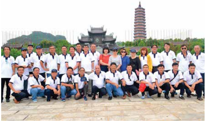
Đoàn tham quan chụp hình lưu niệm tại Chùa Bái Đính

nghĩa tình mà Tổng công ty đã và đang xây dựng, để chúng tôi có dịp hiểu biết hơn, thêm yêu quê hương, đất nước mình hơn, cũng như càng thêm yêu thương, gắn bó, trách nhiệm với đơn vị, với Tổng công ty. Chuyến đi còn để mỗi người cảm nhận tình đồng chí, đồng nghiệp, tình anh em của những con người suốt 20 năm cùng đồng hành dưới Mái nhà chung - Đại Gia đình Tân cảng; chiêm nghiệm về những cái Tân cảng đã đem lại cho mình và trách nhiệm của bản thân trong việc góp phần xây dựng Tổng công ty ngày càng phát triển. Không biết đến khi nào Tôi lại có được cái cảm giác áp áp, thân thương trong vòng tay đồng chí, đồng nghiệp như chuyến đi này. Kết thúc chuyến đi, chúng tôi tự nhủ với lòng mình khi trở về với công việc thường ngày mỗi