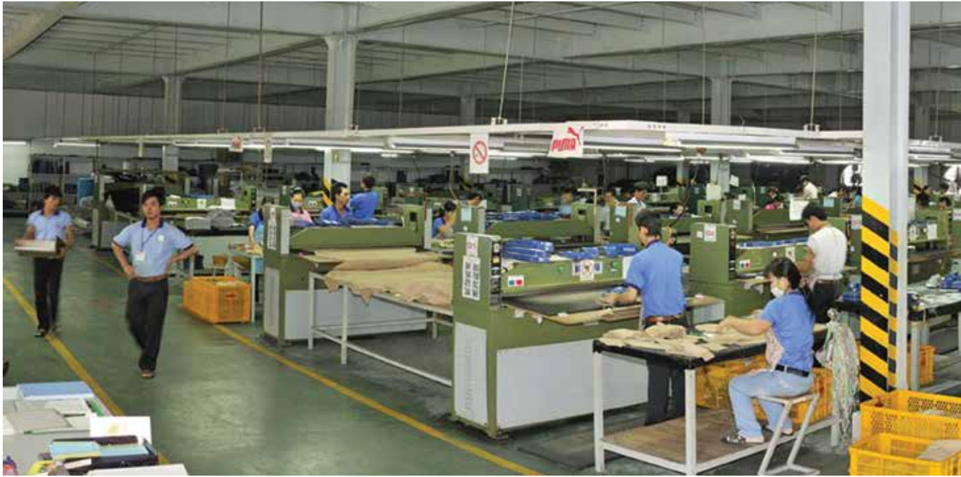
Cơ sở sản xuất của Công ty tại quận Thủ Đức, Thành phố Hồ Chí Minh One of Dong Hung group's workshop at Thu Duc District, HCMC