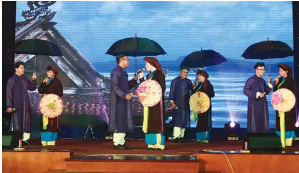
Tiết mục tham gia Liên hoan của Kho vận TC, XDCT, ĐTPHT, cảng TC-CM, cảng quốc tế TC-CM, cảng TC-CM Thị Vải.