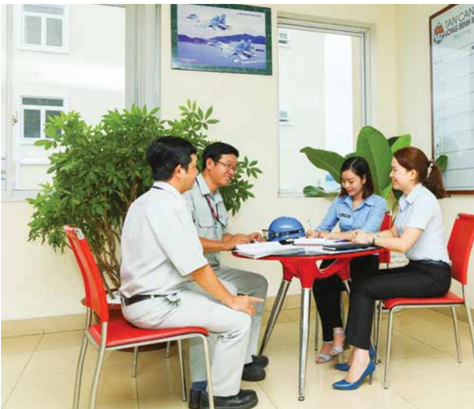
Nhân viên Sales Marketing chăm sóc khách hàng

Không ngừng cải tiến sản xuất, nâng cao năng suất lao động, 6 tháng đầu năm, Công ty đã thực hiện cải cách công tác quản lý, đã bố trí nhân sự phù hợp với tình hình thực tế đạt hiệu quả cao (NSLĐ tính theo doanh thu trừ chi phí 6 tháng đạt 308,50 triệu đồng/người, tăng 27,28% so với cùng kỳ 6 tháng năm 2016; NSLĐ tính theo lợi nhuận 6 tháng đạt 186,43 triệu đ/người, tăng 33,26% so với cùng kỳ 6 tháng năm 2016; NSLĐ tính theo doanh thu 6 tháng đạt 851,69 triệu đ/người, tăng 27,06% so với cùng kỳ 6 tháng năm 2016; 6 tháng cuối năm, tiếp tục thực hiện các chính sách khuyến khích tính tự chủ trong công việc tại các phòng ban, nâng cao năng suất lao động. Đặc biệt cải cách công tác khoán lương theo doanh thu và lợi nhuận cho khối phát triển dịch vụ mới của từng nhân viên Sales Marketing của Phòng KH-KD thay vì khoán cho cả phòng như trước đây ■