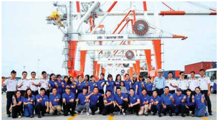
Đoàn Thanh niên TCT TCSG tham quan cảng Tân cảng Cái Mép – Thị Vải

Tại Trung tâm Điều dưỡng thương binh và người có công Long Đất, tuổi trẻ TCSG đã có dịp gặp mặt, giao lưu văn nghệ, thăm hỏi, tặng quà các bác, các