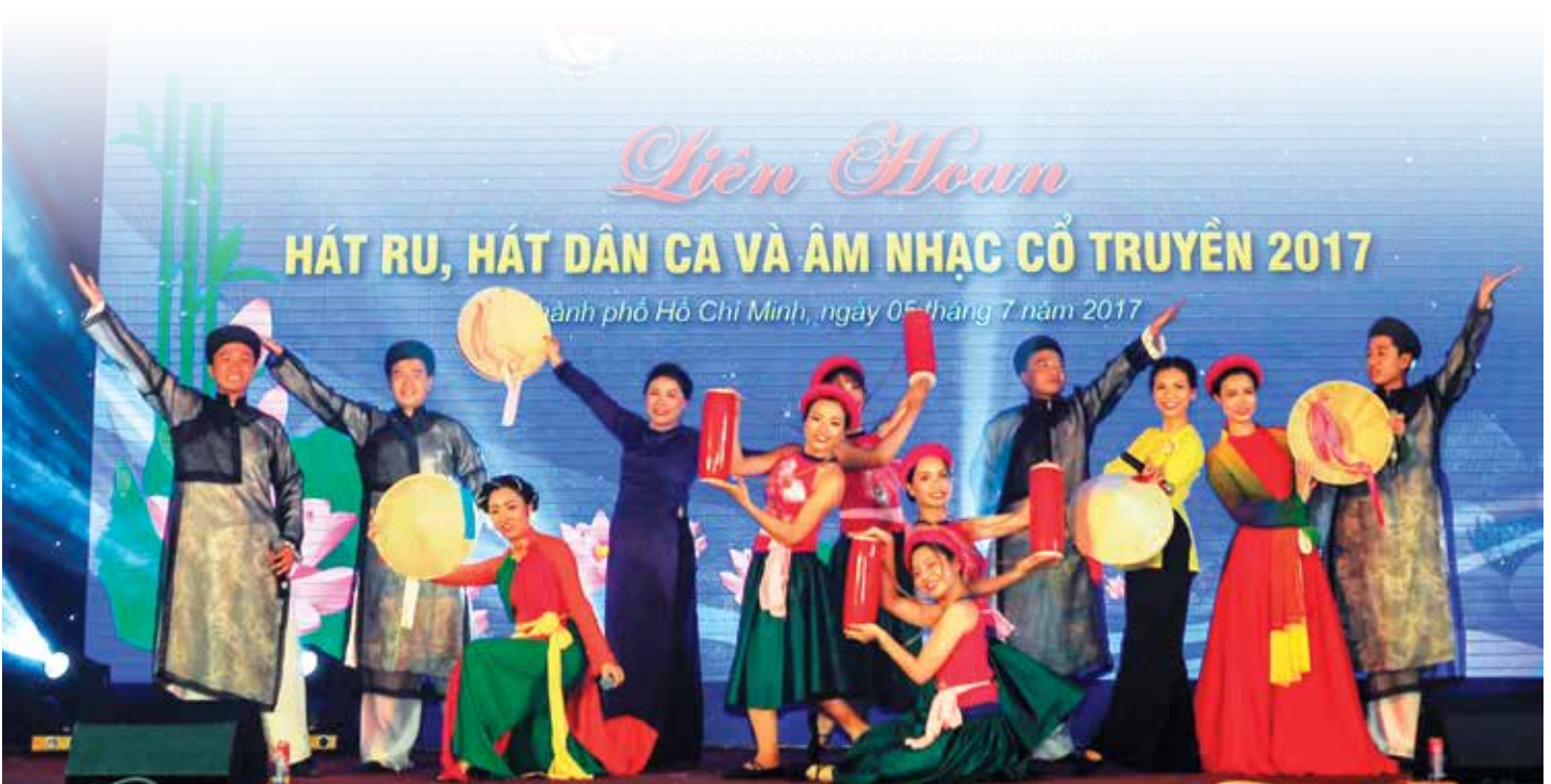
Tiết mục tham gia Liên hoan của HPNCS Văn phòng, TCLĐ, Tài chính, KHKD, ATPC, QLCT, TC Hiệp Phước, VP Miền Tây NB

Liên hoan đã kết thúc, nhưng dư âm của những làn điệu hát ru, hát dân ca, nhạc cổ truyền gần gũi, thân thương còn đọng mãi, thấm sâu và lan tỏa trong tâm hồn mỗi cán bộ, công nhân viên, chiến sỹ, người lao động ở Tổng công ty, trở thành giá trị văn hóa quan trọng trong đời sống tinh thần, góp phần tiếp tục làm phong phú, sâu sắc hơn diện mạo Văn hóa doanh nghiệp TCSG.