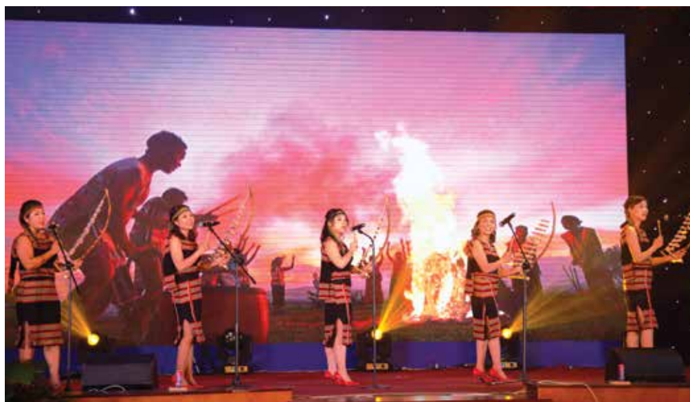
Tiết mục tham gia Liên hoan của HPNCS TTĐĐC, MKT, TCSM, Hậu cần, TC Phú Hữu, VP MB.