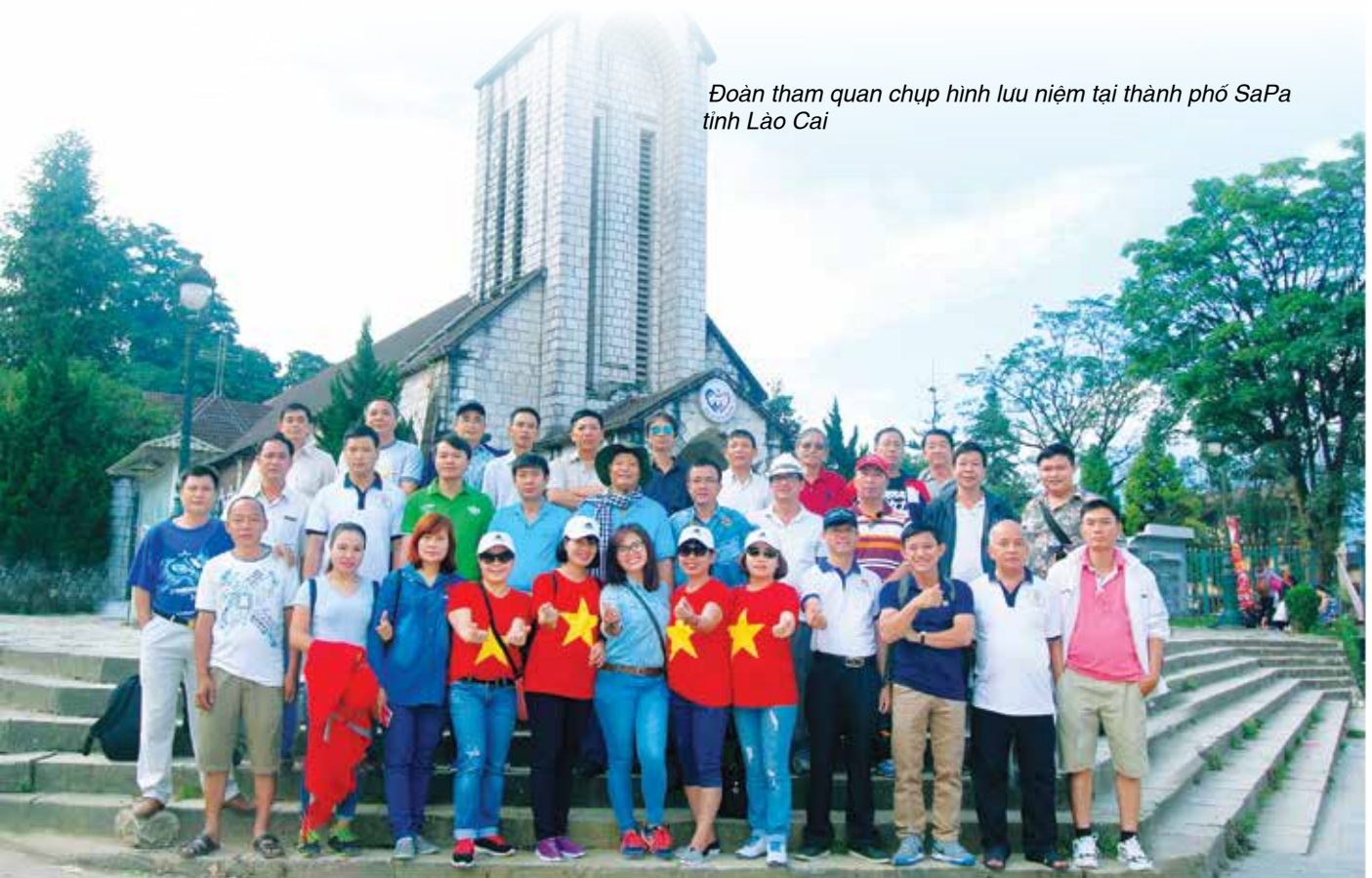
Đoàn tham quan chụp hình lưu niệm tại thành phố SaPa tỉnh Lào Cai

người sẽ cố gắng hơn nữa trong công việc góp một phần công sức nhỏ của mình cho Tổng công ty mỗi ngày một phát triển hơn, để nhiều thế hệ tiếp theo có được những chuyến hành trình trải nghiệm như chúng tôi. Xin được cảm ơn lãnh đạo Tổng công ty, Công đoàn Tổng công ty đã tạo điều kiện cho chúng tôi có một chuyến đi vui tươi, đầy ý nghĩa, kết chặt tình cảm yêu thương, gắn bó của các thành viên trong Đại Gia đình Tân cảng ■